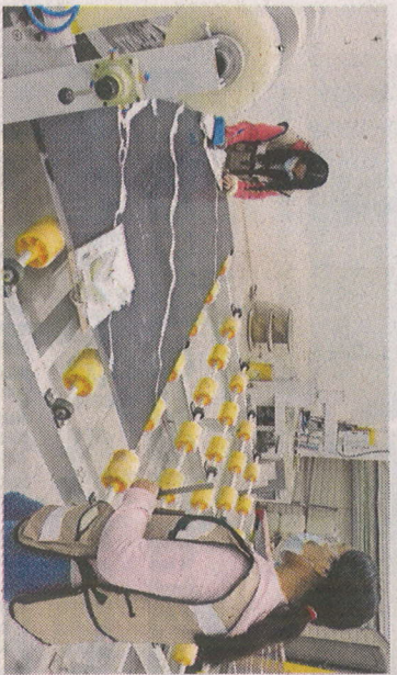
La empresa genera 700 empleos directos.